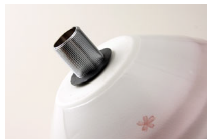
③裏穴に食い込む様に 密着させる