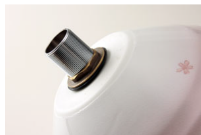
⑥しっかりと締め付ける