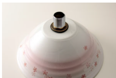
⑦一時取り付け完了 裏面にコーキングを塗る