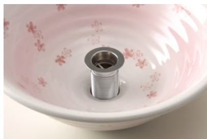
①排水金具を分解後上から 穴部分に差し込む