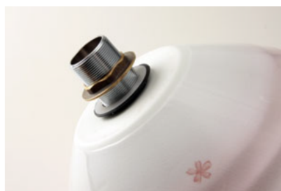
⑤排水金具付属の金色の ワッシャー