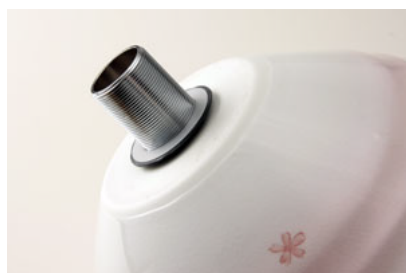
④排水金具付属の薄い スペーサー