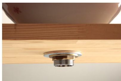
⑩フランジを工具で締め付ける